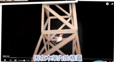
困在木架內的精靈