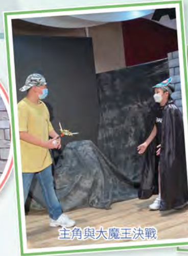
主角與大魔王決戰